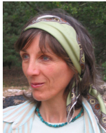
EVA DAVID : MISE EN SCENE

Après des études musicales et la participation en tant que choriste aux chorales de Mulhouse, Metz et Besançon Michel Liotta fonde et dirige la chorale de Saint-Germain-en-Laye, puis en 1967 à Genève la chorale Rive Gauche . En 1970 il est le co-fondateur du mouvement A Coeur Joie Suisse . En 1979 il fonde La Boîte à Chansons , une maison d'édition de partitions pour chorales qu'il dirige jusqu'à sa retraite en 1993. La même année il fonde également la chorale Le pays de Gex qu'il dirigera jusqu'en 2000. En 1981 il initie le festival annuel inter chorales Chandiver qui rassemble chaque année plus de deux cents choristes. Chanteur depuis 1981 dans la compagnie lyrique Vivre et chanter , avec laquelle il participe à une dizaine de spectacles, il en devient le président et directeur musical en 1991, assurant depuis la création et la direction musicale d'un spectacle tous les deux ans.